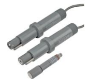
ELECTRODOS PH / ORP