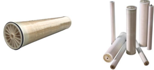
MEMBRANAS TIPO ESPIRAL PARA AGUA PURA