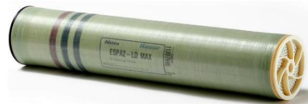
MEMBRANA HYDRANÁUTICA: ESPA4, ESPA3, ESPA2, ESPA4 -LD-4040, ESPA3-4040