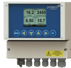
7300W 2 MONITOR