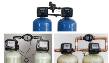
SUAVIZADORES SUPER SOFTENER GEMELO