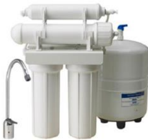
RO4T - 50