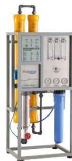
CDVAR – 4000FV