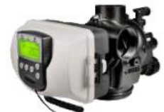
WS3 / WS2H