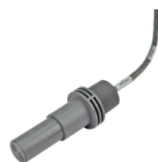
SENSOR DE CONDUCTIVIDAD