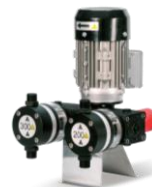
BOMBA MULTIFERTIC PARA PRODUCTOS QUIMICOS