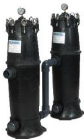
BIG BUBBA BBC – 150P1