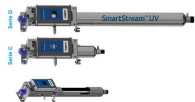
DESINFECCIÓN POR LUZ ULTRAVIOLETA