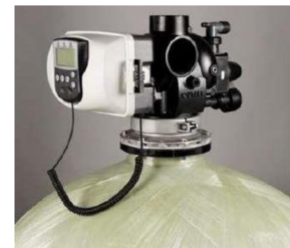
FILTROS CARBÓN ACTIVADO CON VÁLVULA CLACK