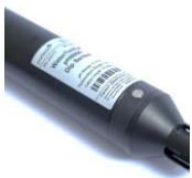
REDOX8000 REDOX / ORP SENSOR