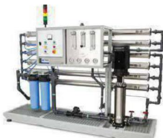
CDHAR – 24000AI