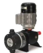
BOMBA DOSTEC 50 PARA PRODUCTOS QUIMICOS