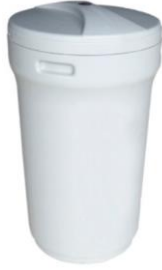
TANQUE DE SALMUERA