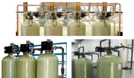
SUAVIZADORES DUPLEX, TRIPLEX Y CUADRUPLEX CON VÁLVULA WS3