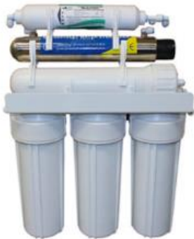
RO5T - 50 - UV