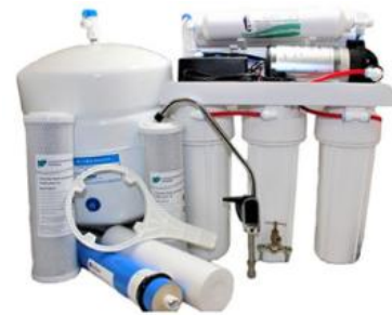
RO5T - 100P