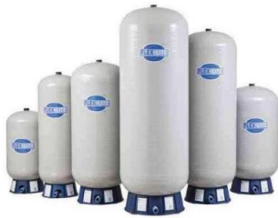
TANQUES DE FIBRA DE VIDRIO