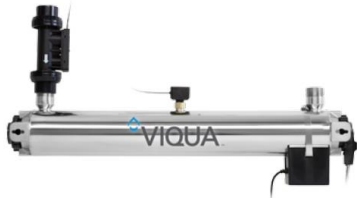
PRO10, PRO20, PRO30 & PRO50 & PRO50