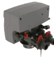
BNT - 85 - TA