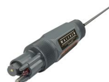
ELECTRODOS DIFERENCIALES DE PH / ORP