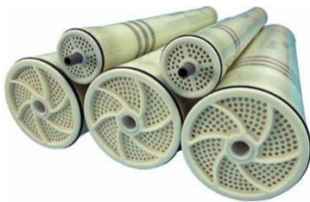
MEMBRANA HYDRANÁUTICA: ESPA4, ESPA3, ESPA2, ESPA4 -LD-4040, ESPA3-4040