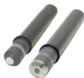
SENSOR DE CLORO LIBRE/BROMO