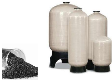
FILTRO DE CARBON ACTIVADO