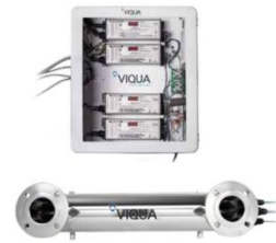
SHF-140, SHF-180, SHF-290, SHFM-140, SHFM-180 & SHFM-290