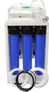
RO5 - 300P