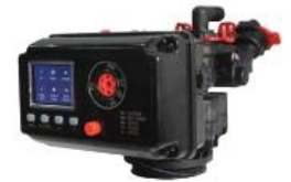
BNT - 95