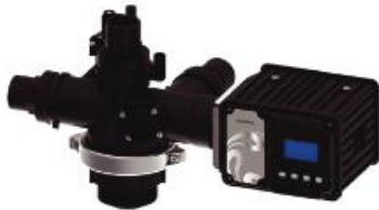
VÁLVULA DE CONTROL BNT105